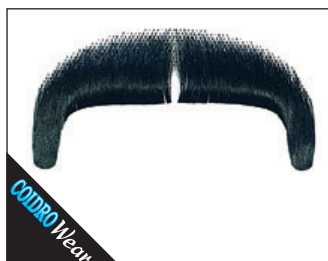
3 0091 Gangster (handgeknüpft) 02 schwarz, 03 blond, 05 braun, 08 grau