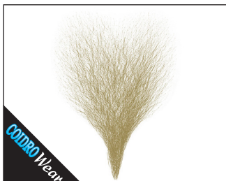
3 0097 Brusthaartoupet (handgeknüpft) 02 schwarz*, 03 blond