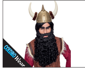
3 0150* Bart gelockt 05 braun, 08 grau-meliert*, 09 grau*