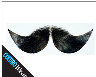
3 0089 Schnurrbart de Luxe (handgeknüpft) 02 schwarz, 03 blond, 05 braun*, 08 grau*