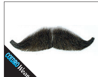
3 0090 Gilbert de Luxe (handgeknüpft) 02 schwarz, 03 blond*, 05 braun, 08 grau