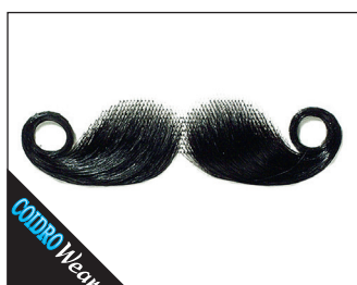
3 0142 kleiner Wilhelm (handgeknüpft) 02 schwarz