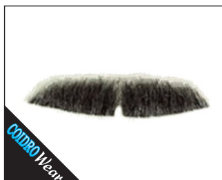
3 0139 kleiner Agent (handgeknüpft) 02 schwarz, 05 braun