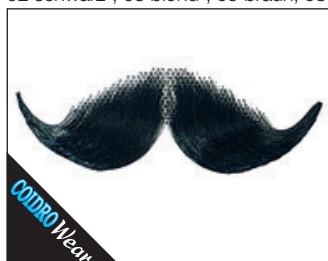
3 0092* Schnurrbart (handgeknüpft) 02 schwarz