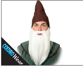
3 0148 Bart glatt 01 weiss, 02 schwarz, 05 braun, 08 grau-meliert