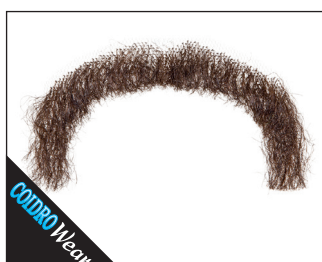
3 0159 Schnurrbart Kämpfer 03 blond, 05 braun