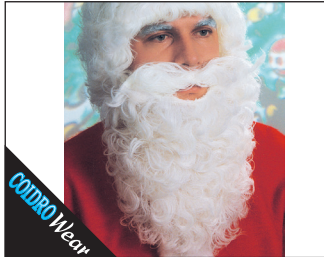
3 0166 Nikolausbart 09 nature