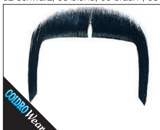
3 0093* Mafiosi (handgeknüpft) 02 schwarz