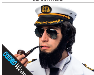
3 0113 Bart Lincoln (handgeknüpft) 02 schwarz*, 03 blond*, 05 braun, 08 grau