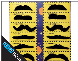
5 0117 Schnurrbartkarte 12 Stk.