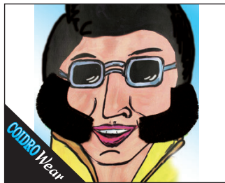
3 0086* Koteletten (handgeknüpft) 02 schwarz