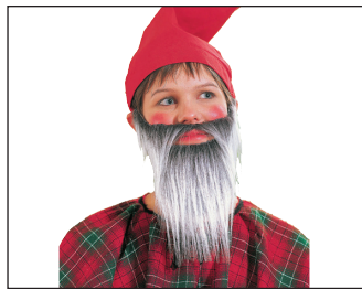
51933 Zwerg 95 grau