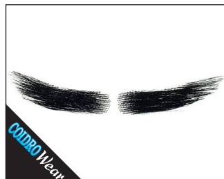
3 0152* Augenbrauen 02 schwarz