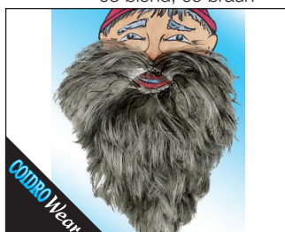
3 0143 Zwergenbart 01 weiss, 02 schwarz, 05 braun, 08 grau