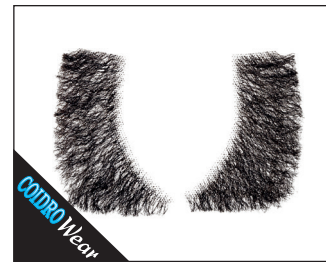
3 0165* Koteletten 02 schwarz