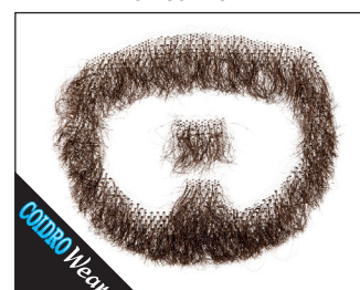
3 0160 Bart Anton 03 blond, 05 braun