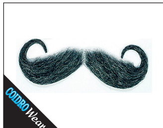
3 0088 Wilhelm de Luxe (handgeknüpft) 02 schwarz*, 03 blond*, 05 braun, 08 grau