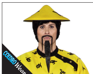
3 0096* Chinese de Luxe (handgeknüpft) 02 schwarz