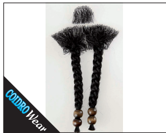
3 0151 Kinnbart mit Perlen 02 schwarz