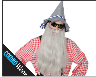
3 0149 Bart glatt extra lang 01 weiss*, 09 grau