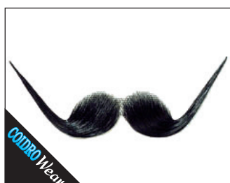
3 0140 Schnurrbart Spitz (handgeknüpft) 02 schwarz