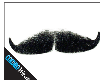
3 0141 kleiner Schnauzer (handgeknüpft) 02 schwarz