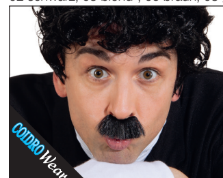
3 0094* Komiker (handgeknüpft) 02 schwarz