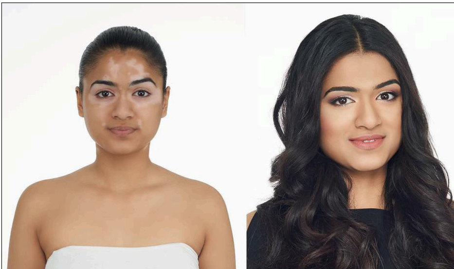
Dermacolor Camouflage Make-up

lor Camouflage Kurs, typgerechtes Make-up oder Glamour Make-up Kurs, es hat sicher für jeden etwas dabei. Infos zu den Kursen finden Sie unter coidro.ch oder kryolan.ch .