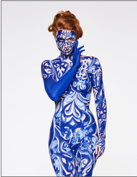
Bodypainting & Airbrush

Kryolan beliefert die Film-, Theater- und Fernsehindustrie seit mehr als 70 Jahren. Das macht sie zu einer der ersten Marken für professionelles Make-up weltweit. Dank der riesigen Palette von über 16'000 hochwertigen Make-up-Produkten und -Zubehör ist Kryolan früher wie heute die erste Wahl für Make-up-Profis. Der Erfolg gibt ihnen Recht. Kryolan-Produkte werden inzwischen in mehr als 80 Ländern auf allen Kontinenten eingesetzt.