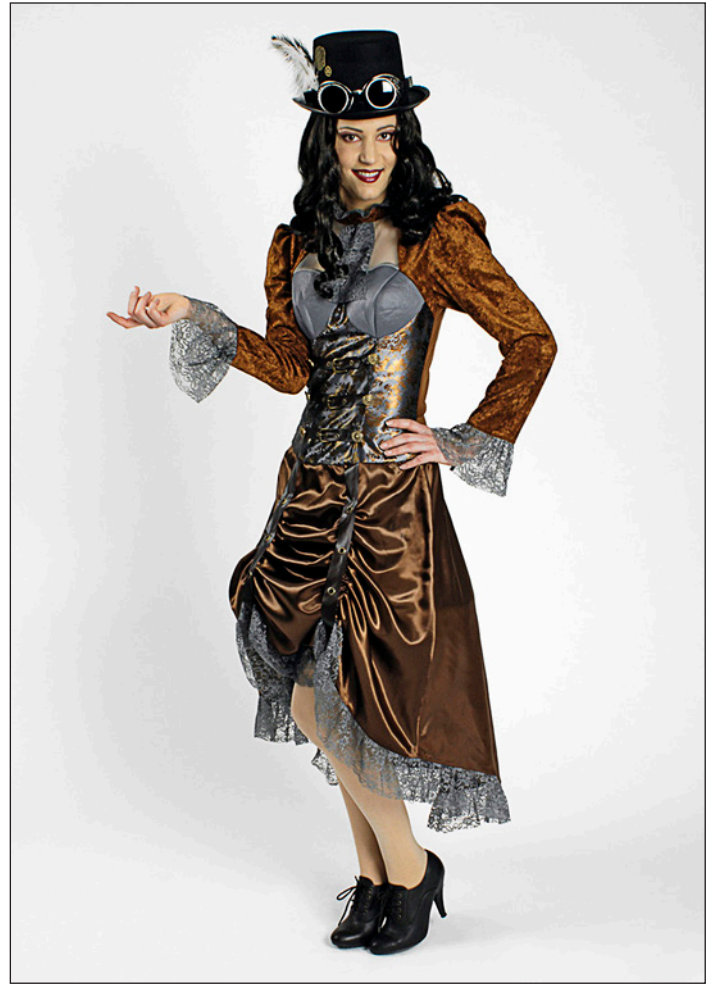
Fasnachtskostüme, Perücken und Hüte

Nebst den Produkten bietet Coidro auch ein umfassendes Kursprogramm an. Einerseits für Profis oder einfach für Interessierte. Egal ob Theaterschminkkurs, Dermaco-