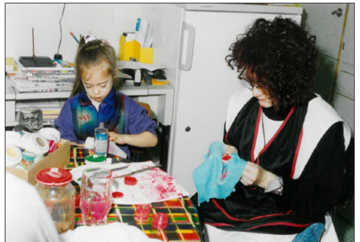
Grosse Aquacolor Dosen wurden in kleine umgefüllt