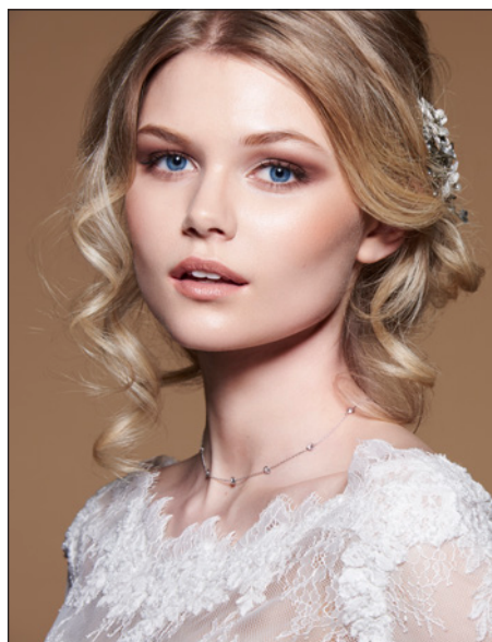
Beauty & Braut

len Anforderungen. Theater-Make-up beispielsweise muss äusserst strapazierfähig gegenüber Hitze, Feuchtigkeit und Bewegung sein. Um allen professionellen Ansprüchen zu genügen, ist jedes einzelne unserer Produkte ein High Performance Produkt: Unsere Produkte sind hoch pigmentiert. Sie behalten ihre Intensität und Leuchtkraft auch unter extremen Bedingungen wie auf der Bühne oder beim HD-Filmdreh. Und kein Produkt von Kryolan wurde jemals an einem Tier getestet. Das war und ist uns wichtig.»