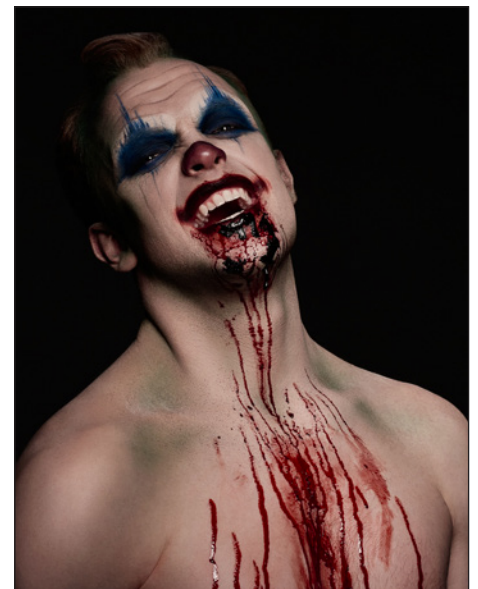
Fasnacht & Special Effect